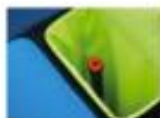
17. GROSSES AUFBEWAHRUNGSFACH FÜR SCHLÄGER UND ZUBEHÖR