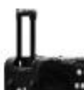
1. AUSZIEHBARER TROLLEY-GRIF