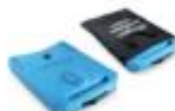
19. SLINGER OSCILLATOR