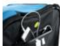
4. USB-LADEANSCHLUSS FÜR HANDY/TABLET