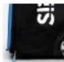
7. SEITENFACH ZUR EINSTELLUNG DES AUSWURFWINKELS