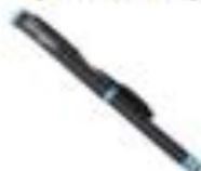
18. PICK-UP BALLRÖHRE