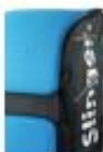
5. SEITENFACH ZUR AUFBEWAHRUNG DER FERNBEDIENUNG