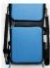
6. SEITLICHE TRAGEGURTE (ZUM ANHEBEN IN DEN KOFFERRAUM)