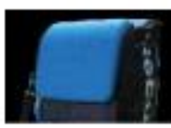
14. BALLFACH GESCHLOSSEN (TRANSPORT)