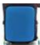
13. HAUPTFACH LAUNCHER