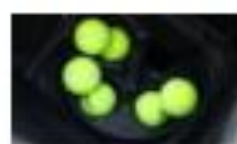
16. ROTATIONS-SCHEIBE FÜR BALLZUFUHR