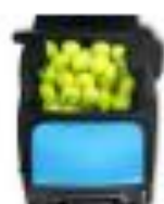
15. BALLFACH OFFEN (BENUTZUNG)