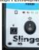
10. ANSCHLUSS FÜR LADEKABEL