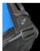
3. HALTERUNG FÜR PICK-UP BALLRÖHRE