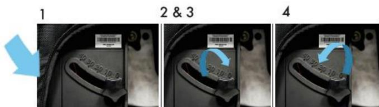
Abb. 2: Auswurfwinkel