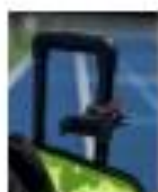
2. MOBILER KAMERA-HALTER