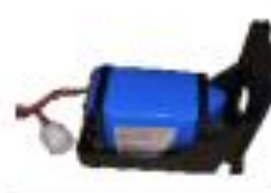
12. LADEFACH INKLUSIVE LITHIUM-IONEN-BATTERIE