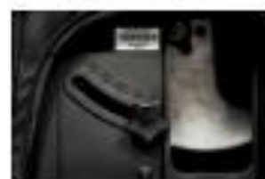
8. POSITION DER SERIENNUMMER